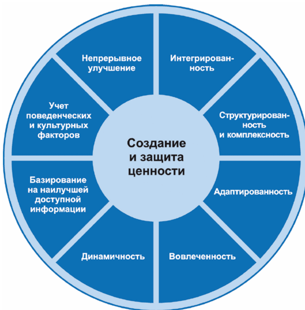
Рисунок 2 - Принципы

принципы являются основой менеджмента риска и должны учитываться при создании структуры и процесса менеджмента риска организации. Соблюдение принципов позволит организации управлять влиянием неопределенности в отношении достижения целей организации.