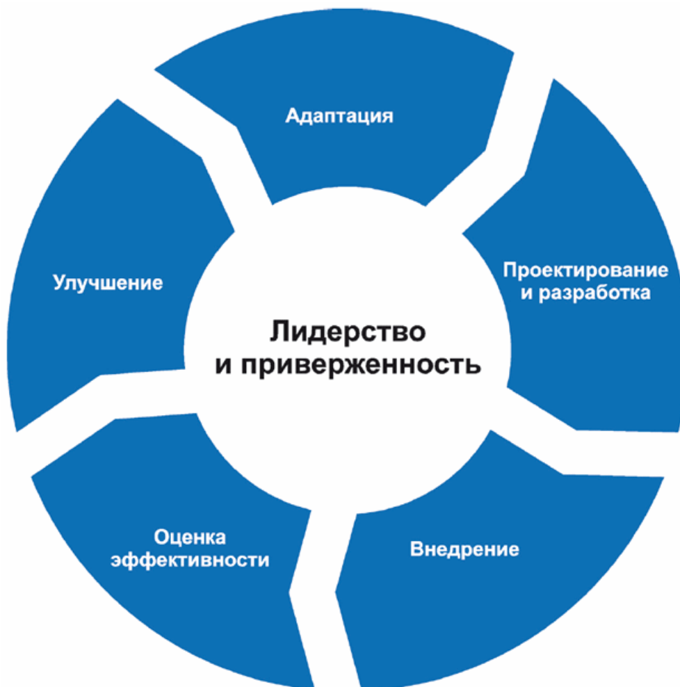
Рисунок 3 - Структура

Организация должна оценить существующую практику и процессы менеджмента риска, выявить существующие недостатки и устранить их в рамках структуры.